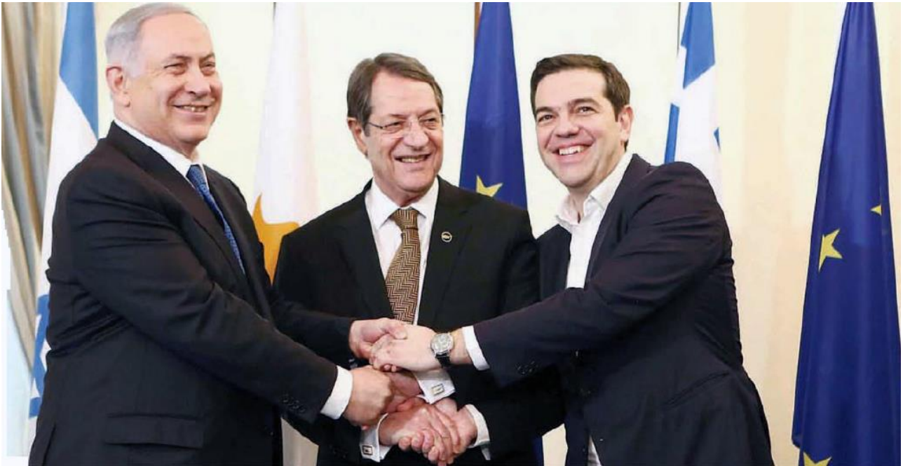
Από Αριστερά: Ο Πρωθυπουργός του Ισραήλ Βενιαμίν Νετανιάχου, ο Πρόεδρος της Κυπριακής Δημοκρατίας Νίκος Αναστασιάδης και ο Πρωθυπουργός της Ελλάδας Αλέξης Τσίπρας.